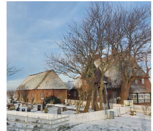
Kirchwarft mit Schnee am 29.11.2023

Liebe Gemeinde, lieber Freundeskreis und liebe Gäste,